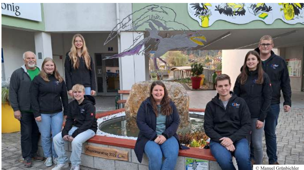
▲ Der neue Metallrabe verleiht dem Raben-Stein-Brunnen seine markante Mitte und steht für Gemeinschaft und Kreativität.

neue Wahrzeichen wird noch lange an den Einsatz unserer jungen Generation erinnern.