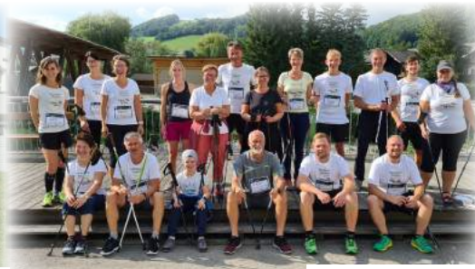
Vision Run