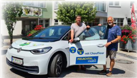
E-Fahrtendienst Hoi-Mi-Rabe