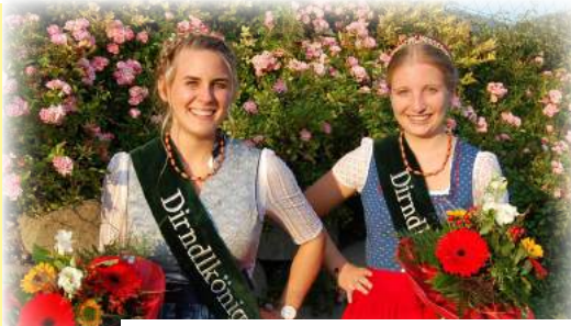
Neuwahl Dirndlhoheiten