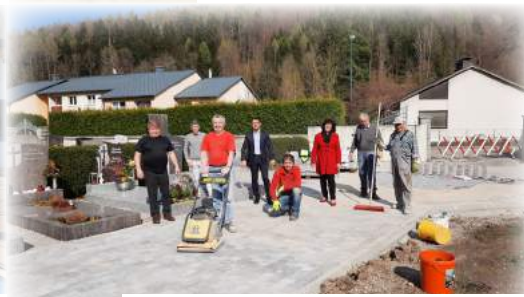
Verbesserungsmaßnahmen Friedhof