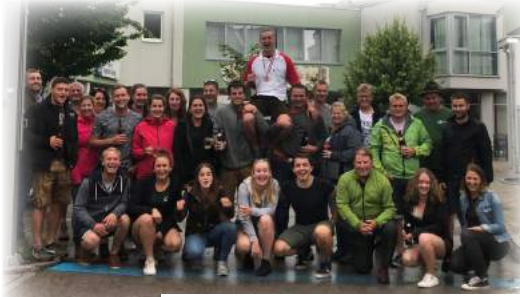
Bundesentscheid Sensemähen