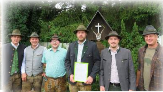
neue Jagdaufseher