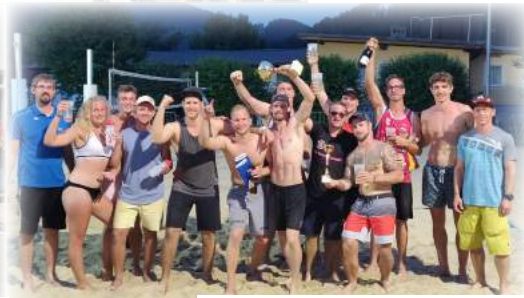
Ravenstone Beachvolleyball