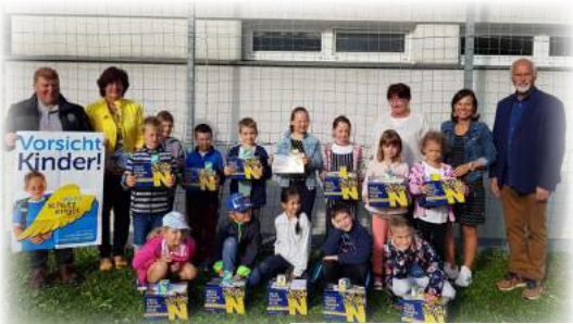
Aktion Schutzengel