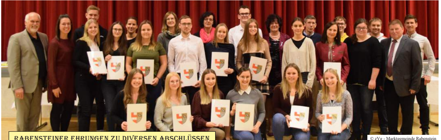
RABENSTEINER EHRUNGEN ZU DIVERSEN ABSCHLÜSSEN