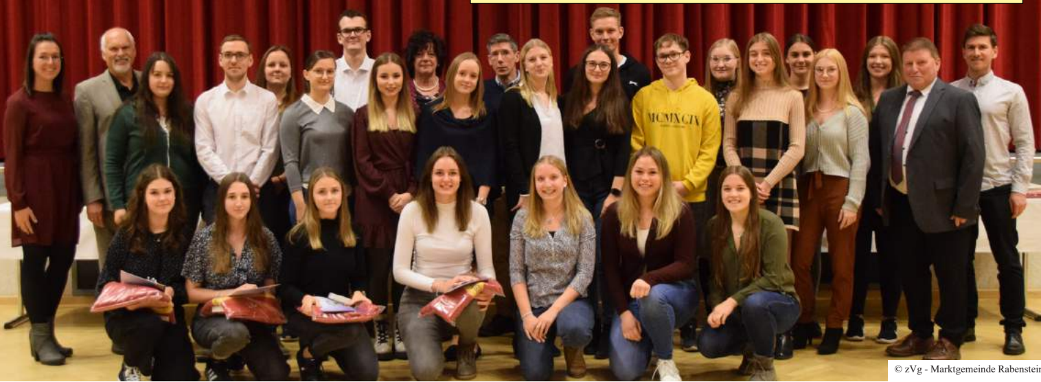
RABENSTEINER JUNGBÜRGER DER JAHRGÄNGE 2002, 2003 & 2004