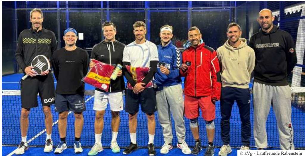
▲ Die Vorfreude auf die Padelturniere 2026 ist bereits jetzt groß – und wir dürfen uns sicher wieder auf viele spannende Matches und ein tolles Miteinander freuen!

auch den Hauptsponsor Autohaus Schmal für die wertvolle Unterstützung.